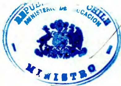
RICARDO LAGOS ESCOBAR Ministro de Educación