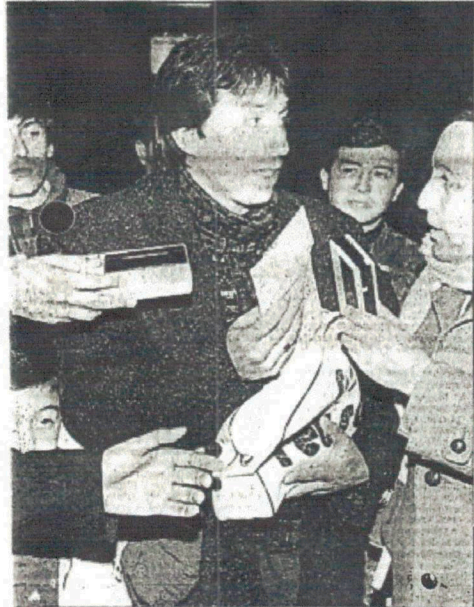
VOJAS REGRESO A SANTIAGO. — Pasadas las 21 horas de anoche el ex arquero de la selección chilena, Roberto Rojas, llegó a Santiago luego de permanecer algunos días en Ilorrico, tras declararse culpable en el escándalo de Maracanã. Hoy dará conferencia de prensa. En la foto, el ex jugador abandona Pudahuel. (C 11)