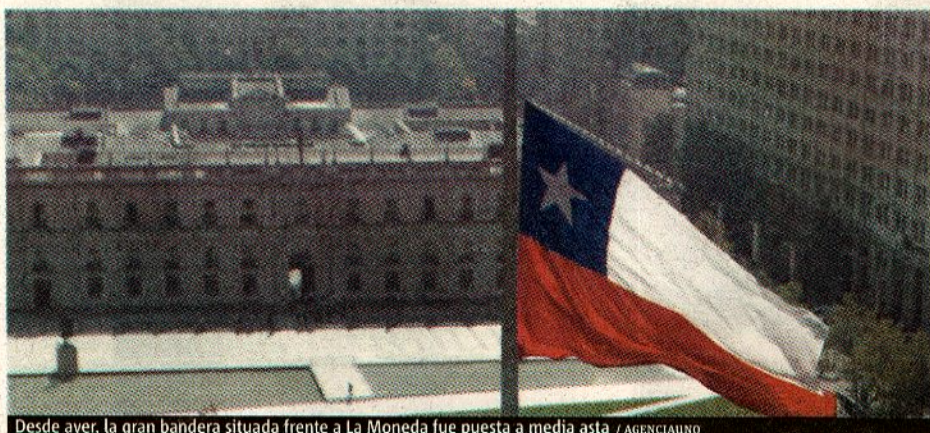
Desde ayer, la gran bandera situada frente a La Moneda fue puesta a media asta