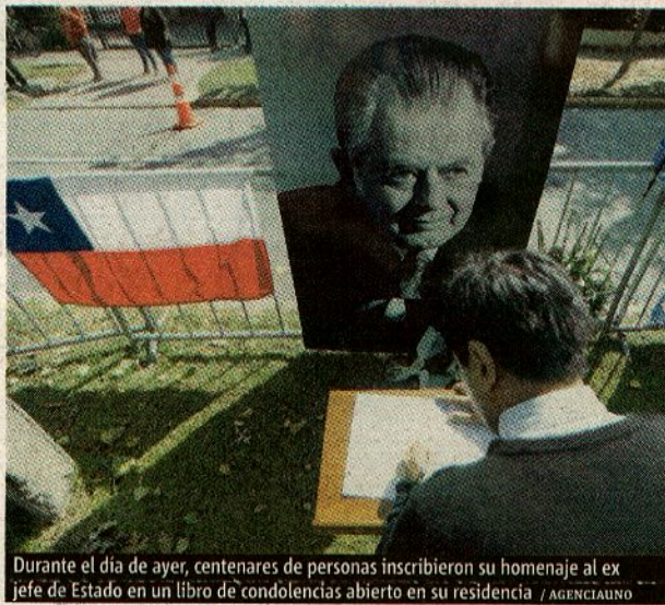
Durante el día de ayer, centenares de personas inscribieron su homenaje al ex jefe de Estado en un libro de condolencias abierto en su residencia

"Ha sido para nosotros no sólo un padre ejemplar, sino