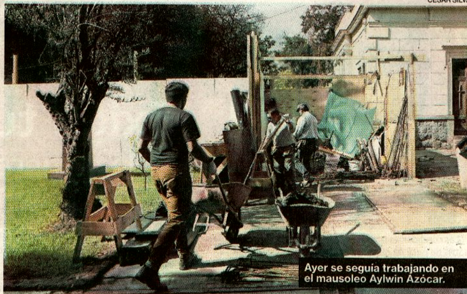
Ayer se seguía trabajando en el mausoleo Aylwin Azócar.

El proyecto —que fue autorizado en diciembre pasado por el Consejo de Monumentos Nacionales, ya que implica la intervención en el llamado Casco Histórico del recinto— contempla la construcción de una bóveda subterránea de hormigón armado, para dos sepulturas y