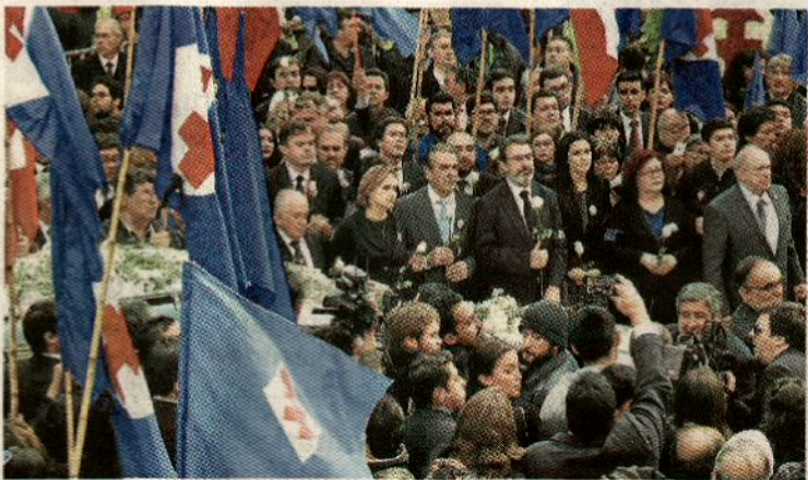
►► La timonel de la DC, Carolina Goic, y militantes de la colectividad despiden al ex Presidente Aylwin en el frontis del partido en la Alameda.