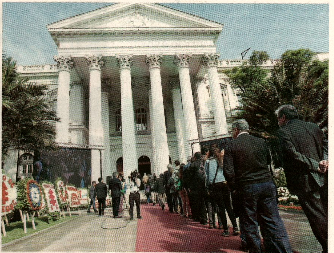
►► Miles de personas llegaron hasta la sede del ex Congreso Nacional para despedir al ex Presidente.

L a carroza se detuvo un poco más de lo esperado. En plena Alameda, frente a la sede de la Democracia Cristiana, fueron cientos los militantes que se reunieron para despedir a uno de sus camaradas más importantes y queridos. Habían instalado un pequeño escenario y una pantalla con imágenes del ex Presidente.