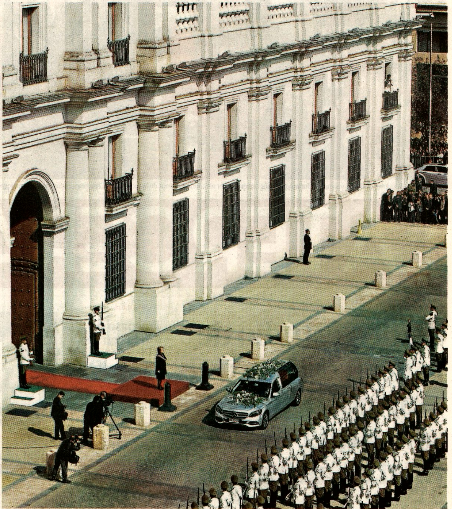
»» A las 12.45 el cortejo fúnebre pasó por La Moneda, donde la Presidenta Bachelet le rindió un homenaje.

» Chris Cornell. El destacado cantautor estadounidense fijó para el segundo semestre su regreso a Chile. El artista traerá a la capital un nuevo show acústico, con su último álbum, Higher truth (pág. 41).